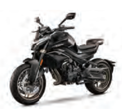
800NK Sport / Advanced TC