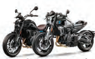
700CL-X Heritage / Sport