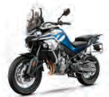
800MT Sport +