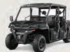
UFORCE 1000/XL - 3 et 5 places