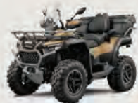
CFORCE 1000 OVERLAND