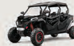
ZFORCE 950 Sport - 2 et 4 places