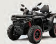
CFORCE 1000 S et R