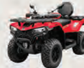
CFORCE 520 Court/Long