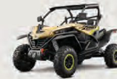
ZFORCE 1000 Sport R