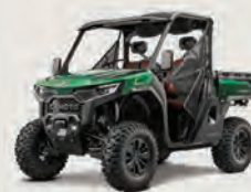
UFORCE 1000 Pro