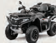
CFORCE 625R Court/Long/Overland